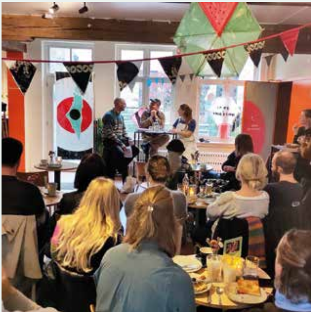
Waarom actie voeren nodig blijft. Debat in Korf.