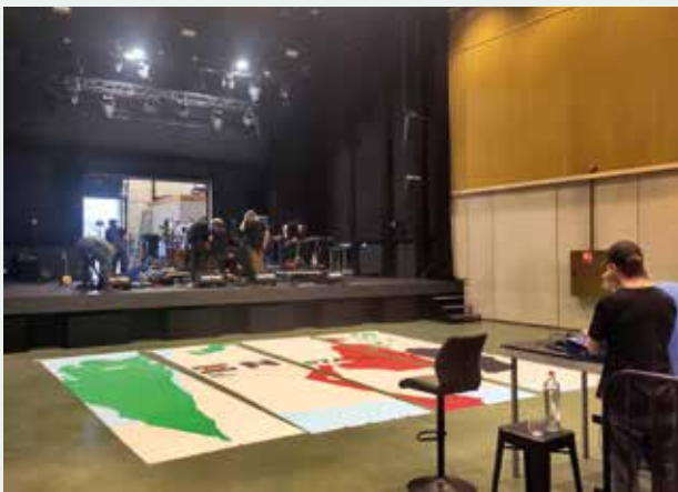
De Batterie maakte een indrukwekkend spandoek tijdens een zeefdrukworkshop.