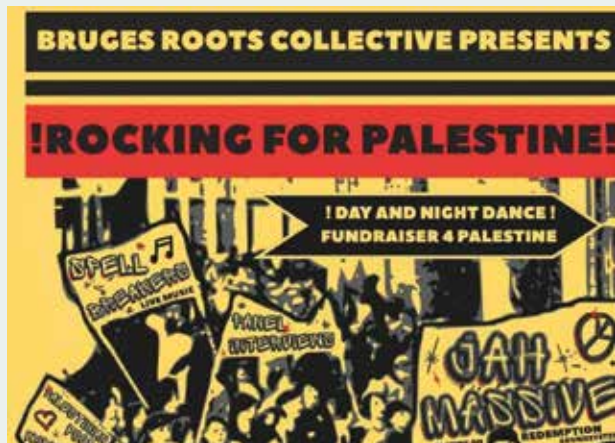
Rocking for Palestine in Jeugdhuis Comma.