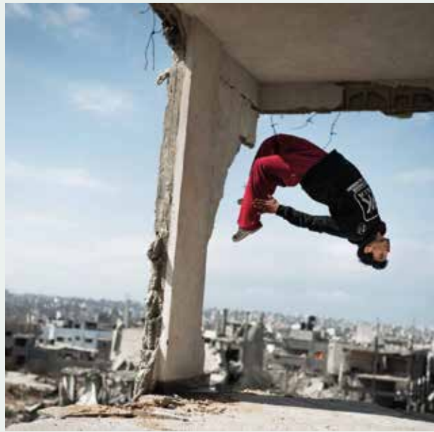
DocFest van de Republiek en Lumière programmeerde de docu Yalla Parkoer.